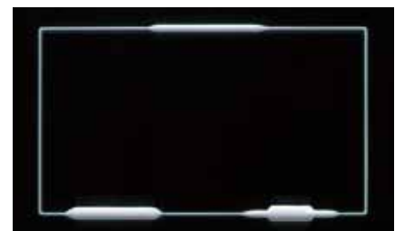
Linienbreite sofort veränderbar