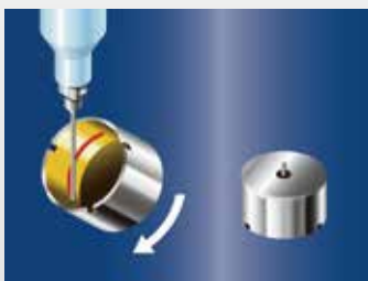
Dosierung von 2-Komponenten-Epoxidflüssigkeit auf Motoren