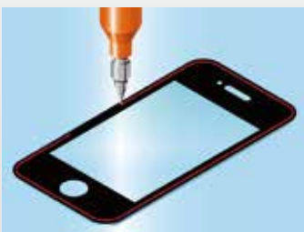
Dosierung von PUR zum Abdichten von Smartphone-Abdeckungen